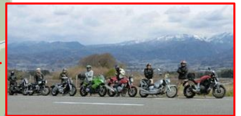
↑望郷ライン 絶景ポイント