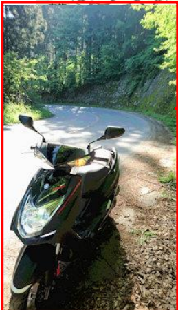
↑魔のヘアピンカーブ