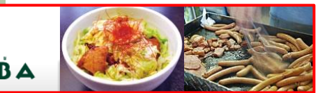
↑道の駅 川場 田園プラザ