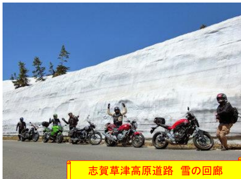
志賀草津高原道路 雪の回廊