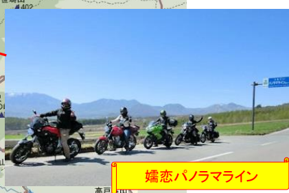
嬬恋パノラマライン