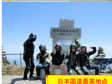
日本国道最高地点