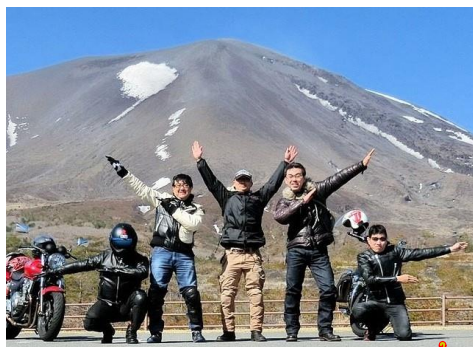
中年戦隊オジレンジャー