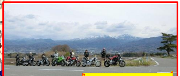
望郷ライン 一本松