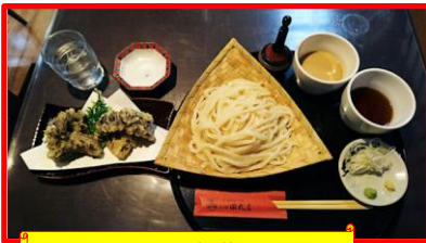
水沢うどん 舞茸天ぷら