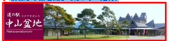
道の駅 なかやまぼんち 中山盆地 Nakayama Bonchi