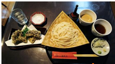
水沢うどん 舞茸天ぷら