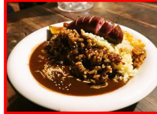
唯我独尊名物カレー