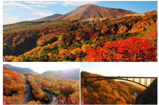
磐梯吾妻スカイライン