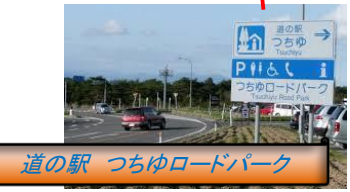
道の駅 つちゆロードパーク