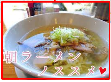
朝ラーメン ノススメ♥