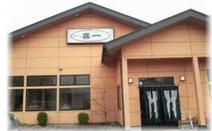
喜多方ラーメン 喜一