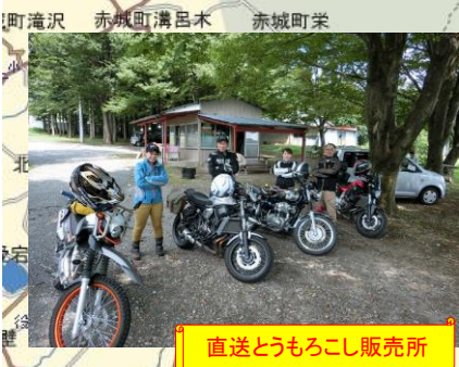
直送とうもろこし販売所