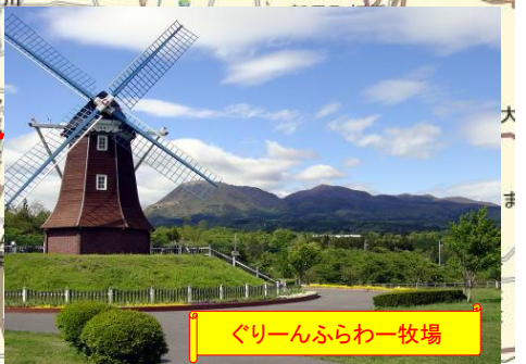
ぐりーんふらわー牧場