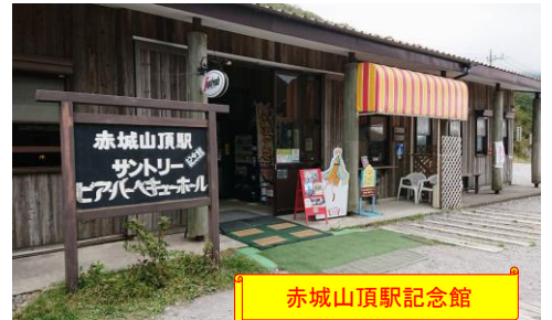
赤城山頂駅記念館